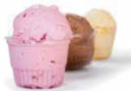
Helado de Coco $30 175 gramos