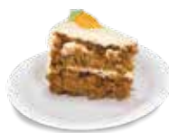
PASTEL DE ZANAHORIA 145 gramos $58