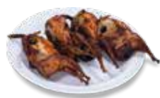
ORDEN DE CODORNIZ 4 piezas $170