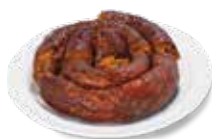
ORDEN DE CHORIZO 330 gramos $160