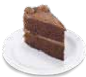
PASTEL DE CHOCOLATE 145 gramos $58