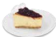
CHEES CAKE 155 gramos $55