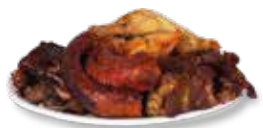
BOTANA MIXTA (5P) 1,100 gramos $560