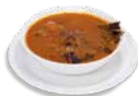
ORDEN DE BIRRIA 300 gramos $150